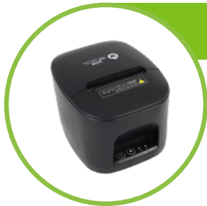
Impresora Jaltech de 80mm