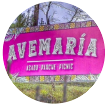
AVE MARIA RESTAURANTE