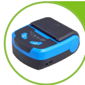
Impresora inalámbrica de bluetooth 80 mm