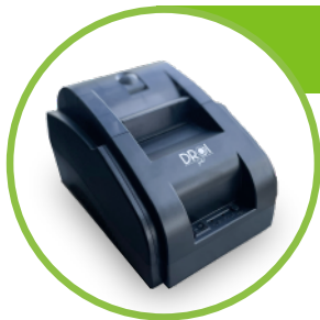
Impresora DROI de 58mm