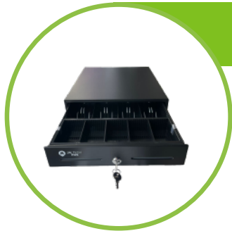
Cajón monedero 3 puestos