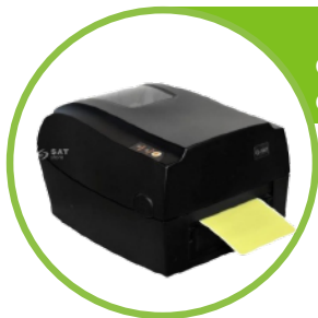
Impresora de codigos de barra con suministro