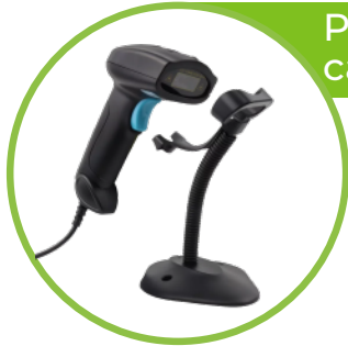
Pistola lectora Jaltech cableada con base