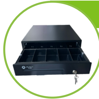
Cajón monedero 5 puestos