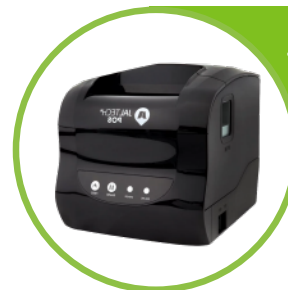
Impresora Jaltech Térmica 2 en 1 80mm (Pos y etiquetas)