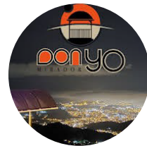
Mirador don Yo