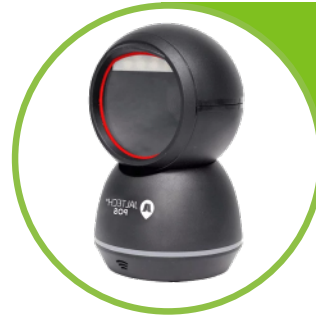
Lector Omnidireccional Jaltech