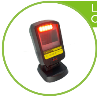
Lector Omnidireccional LEXA